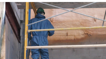
nástřik pěnové izolace FL-2000