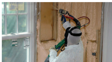
nástřik pěnové izolace FL-500